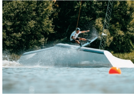
Wakeboarden auf dem See