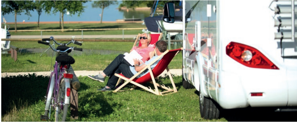
Gemütlich den Tag ausklingen lassen