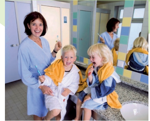
Mit Frische in den neuen Camping-Tag