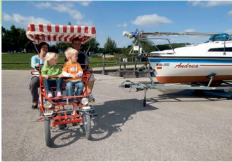
Mit der Rikscha rund um den See